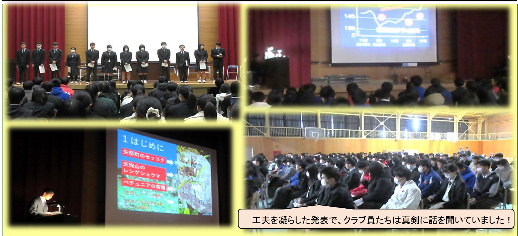
工夫を凝らした発表で、クラブ員たちは真剣に話を聞いていました！