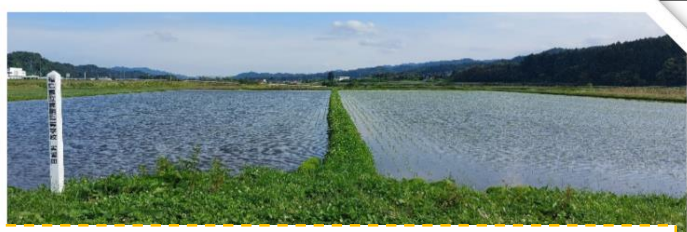
本校水田の様子(5/25)。5/20に生産流通科の3年生が植え付けました！今後に期待😊