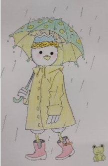
マスコットキャラクター「のうくつく」 食品科学科1年生が 描いてくれました！

校内農業クラブ活動に関しては、「農業クラブ総会」や「校内意見発表大会」など、例年通り行われました。特に「環境調査」は農業科6クラス全員で行いました。実施することができました。本号では校内農業クラブ活動を取りあげました。なかなか落ち着かない社会状況ですが、今やるべきこと、取り組むことを丁寧に着実に