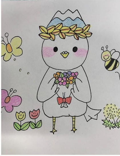
マスコットキャラクター「のうくっく」 「春」バージョン 生産流通科2年生が書いてくれました。 絵に自信がある生徒のご応募大歓迎 です。お待ちしております！！

農業クラブ活動では、新入生オリエンテーションをはじめ、全農業クラブ員で競い合う意見発表大会の原稿作成や各種競技会に向けて少しずつ活動をスタートしています。新型コロナウイルスの対策をしっかりと行いながら、生徒一人一人が農業クラブ員、そして修明高校の一員である自覚を持ち、様々な場面で活躍をこれからも期待します。