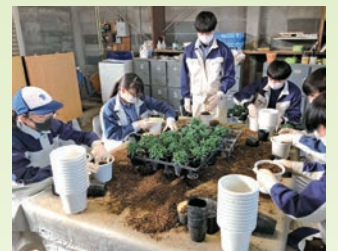
カーネーションの植替え作業