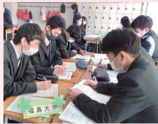
文理科集会 ～3年生と語る会～