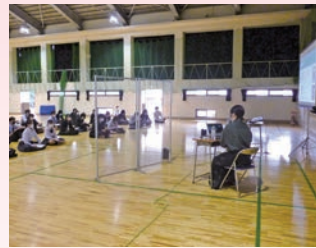
卒業生講演会 ～会津大学OG～