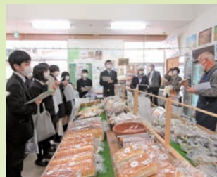
経営マーケティングプログラム