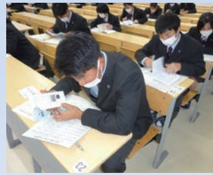
棚倉ふるさと検定