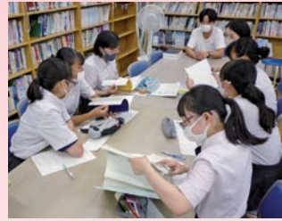
看護系座談会 ～OB訪問～