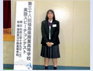
商業高校英語スピーチコンテスト