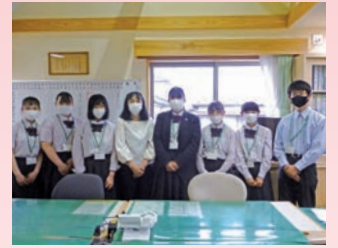
地域連携型職業探究 ～棚倉保育園～