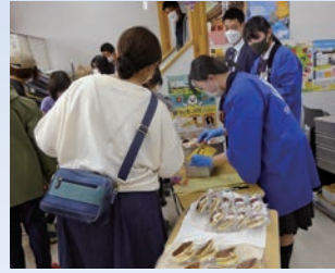
修明笑店(販売実習)