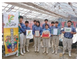
トマト、リーフレタス、ミズナで2種類のGAPを取得しました。