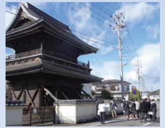
棚倉ふるさと講座