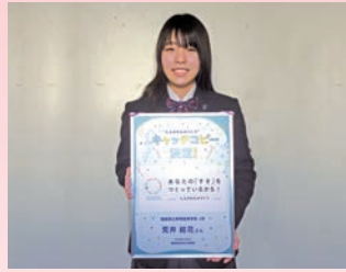
しらかわものづくり キャッチコピー表彰