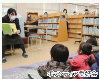
ボランティア愛好会