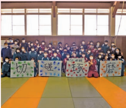
第1回文理科集会 ～レクリエーション～