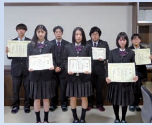
税の作文・標語入賞者

簿記や情報処理などを共通履修後、2年次から興味関心や進路目標に合わせて2コースに分かれて学習し、専門性の深化と職業人としての資質向上を目指します。