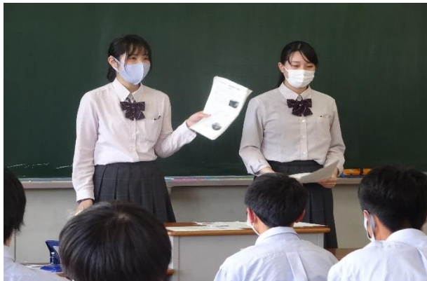
(商品の開発過程について説明する生徒)

商品開発した生徒が、商品開発した経緯やコンセプト・苦労した点などを商業科の生徒に説明し、実際に試食しアンケートを実施しました。