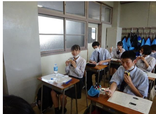
(実際に試食し、アンケートを記入)