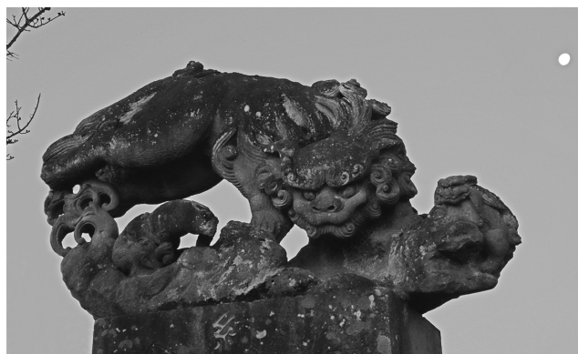
川田神社 月と狛犬