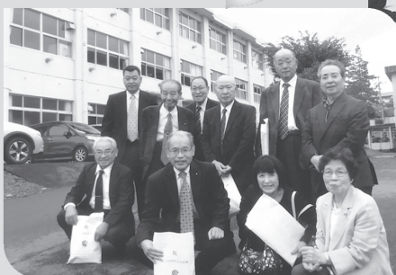
関東支部 食加棟前にて