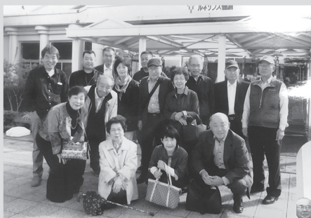
関東支部 ルネサンス棚倉にて