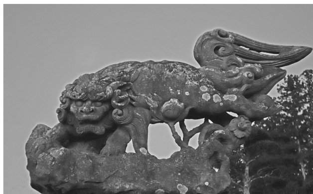
川田神社 阿像狛犬