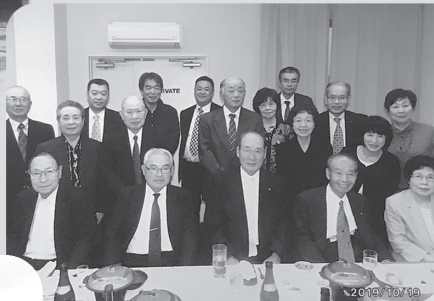
関東支部 新富家にて